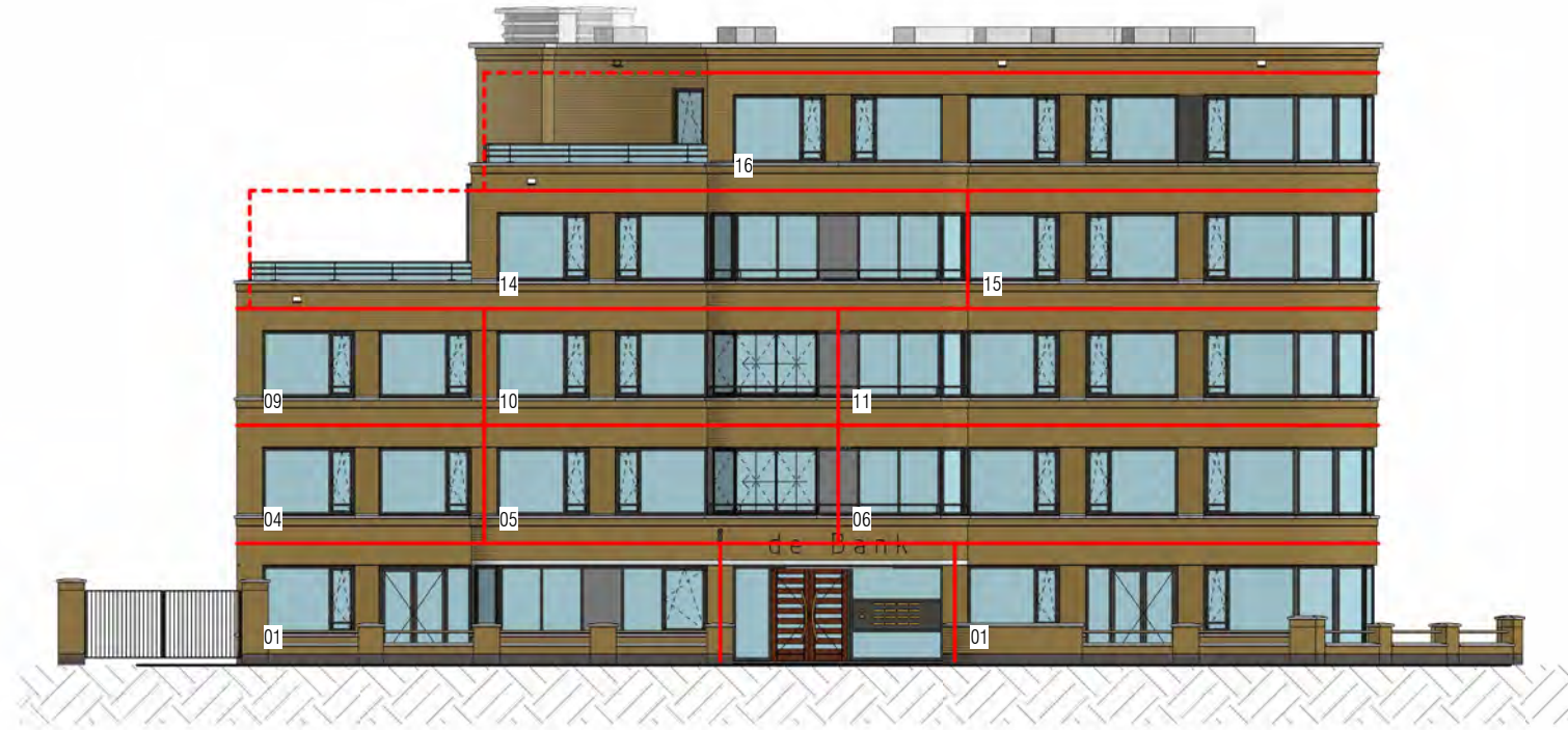
gevel zuid-west (Rozenboomstraat)