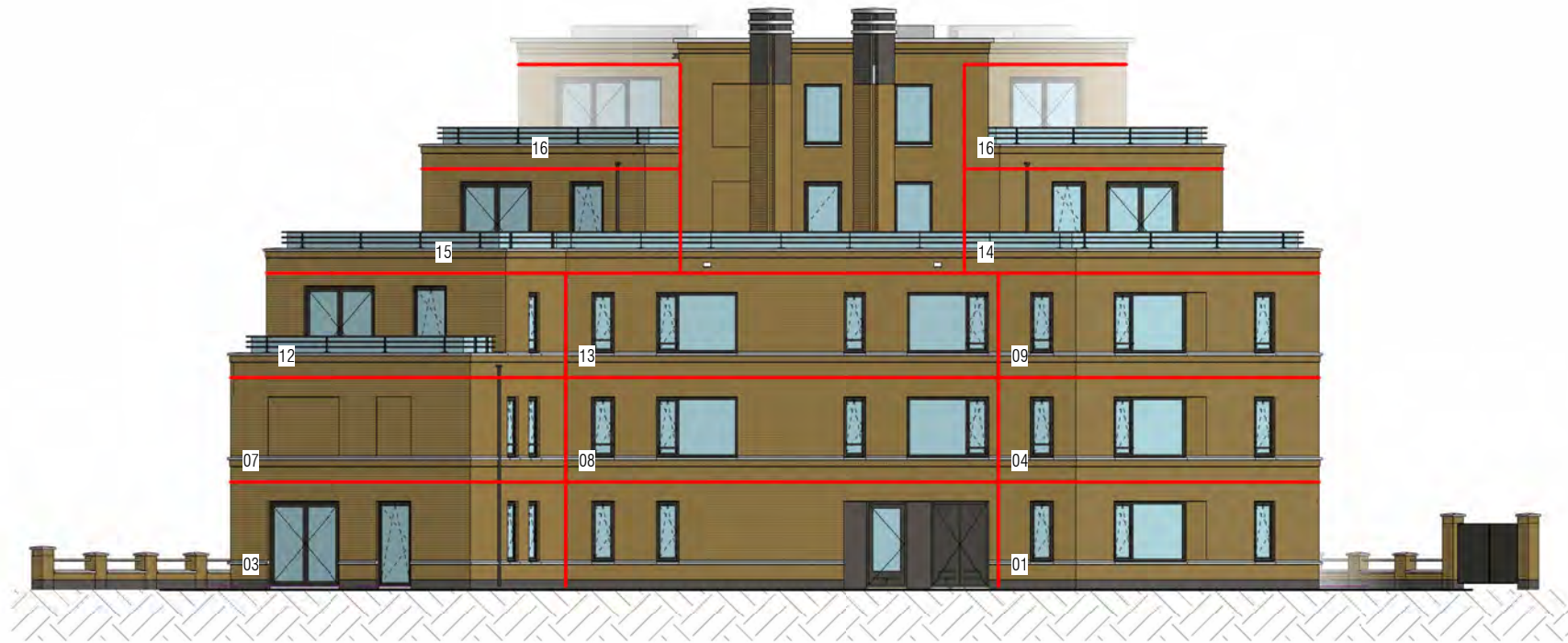
gevel noord (binnen terrein)