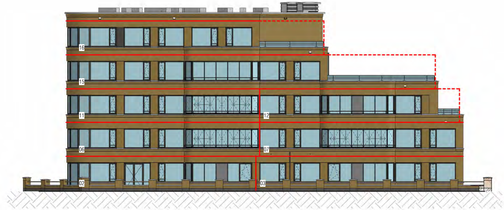
gevel zuid-oost (Parkweg)